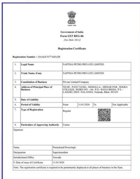
GST Registration Certificate