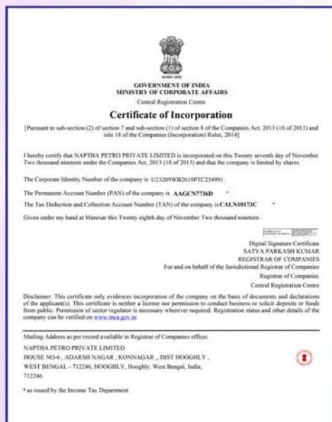
Certificate of Incorporation